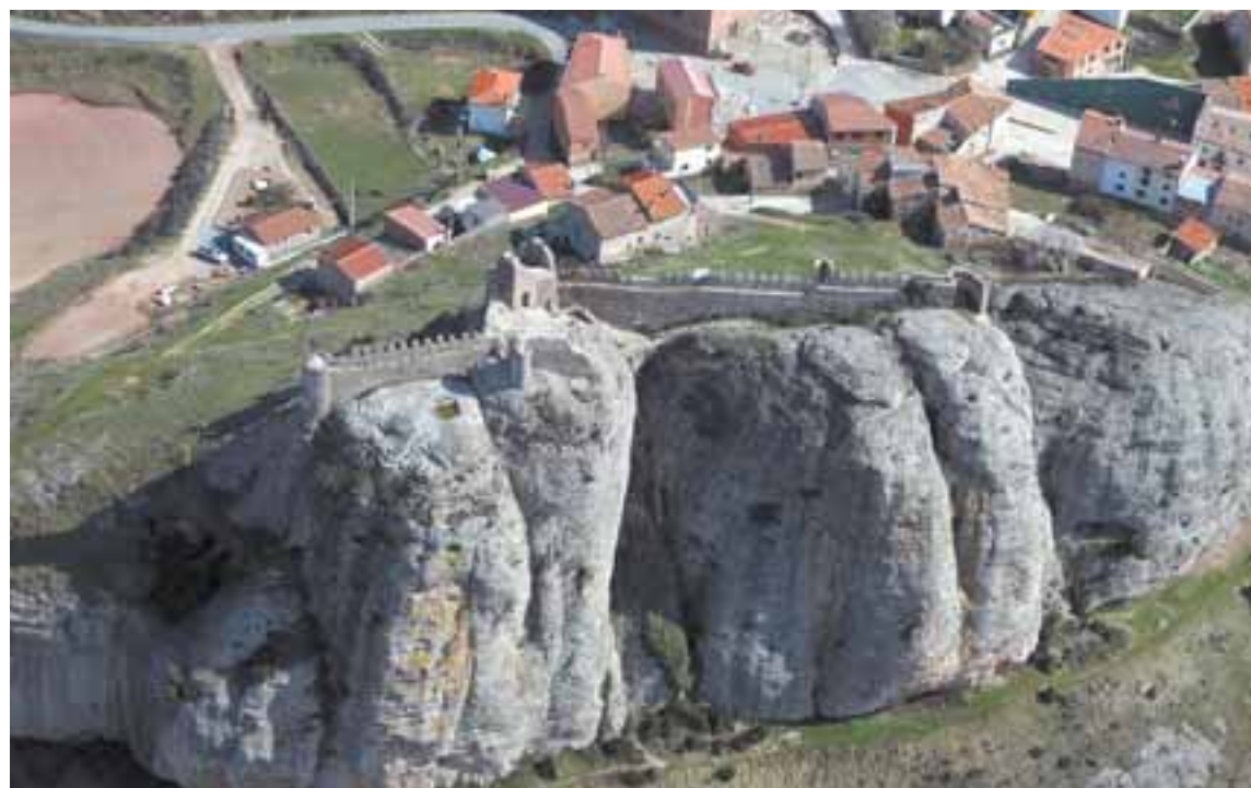
El castillo de Clavijo (La Rioja), encaramado en la roca. IÑAKI SAGREDO

En este tomo, de casi 300 páginas, su autor se centra en las regiones históricas de La Rioja, La Rioja, La Bureba y Cantabria. "A partir del rey Sancho el Mayor, los monarcas navarros que se sucedieron hasta el siglo XVI siempre trataron de recuperar aquellos territorios", señala Iñaki Sagredo. Tampoco hay que olvidar que Nájera llegó a convertirse en la residencia de la corte pamplonesa, precisamente por su situación privilegiada dentro del Rei-